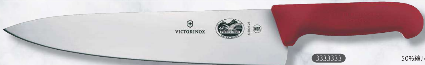
デニッシュ生地に 幅の広い鋭刃で安定性が向上します。 3333333 50%縮尺 シェフナイフ (牛刀) 25cm 刃渡り: 25cm 全長: 38.5cm

130年以上の歴史を誇り、スイスを拠点とするヨーロッパトップクラスの総合ナイフメーカー。 “機能的で実用的な高品質の製品”を心がけ、幅広い商品を取り扱っています。