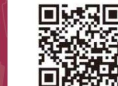
パティスカヌレ基本レシピ

パティス・カヌレ ……450g 無塩バター ……50g 50~60℃のお湯 ……500g ラム酒 ……50g