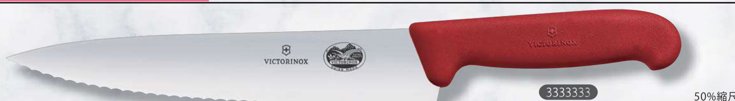
サンドウィッチに 特殊な研磨加工+波刃によって切れ味抜群! 3333333 50%縮尺 サンドウィッチナイフ 刃渡り: 22cm 全長: 35.8cm