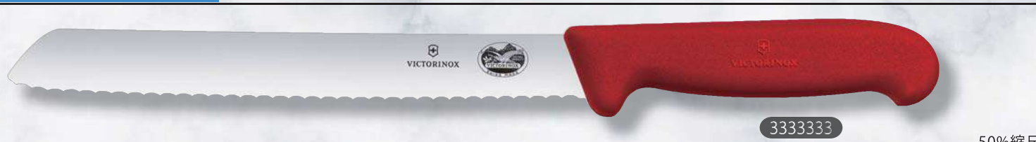
ご家庭向けパン切りナイフに 一般的なパンナイフとして大活躍! 3333333 50%縮尺 ブレッドナイフ SP 刃渡り: 21cm 全長: 35cm