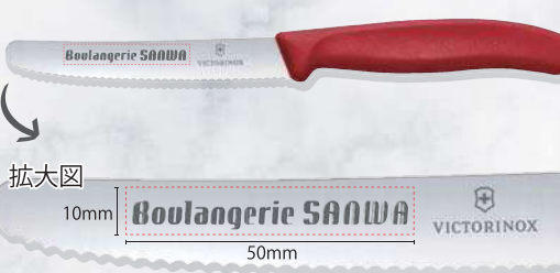
■トマト・ベジタブルナイフ レーザー彫刻可能範囲: W50×H10mm ロット: 100個～ 納期: 約1か月