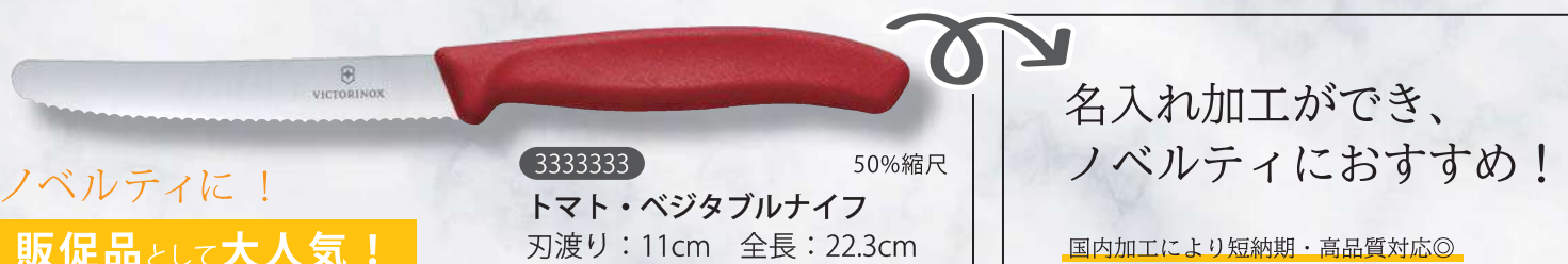
ノベルティに! 販促品として大人気! 3333333 50%縮尺 トマト・ベジタブルナイフ 刃渡り: 11cm 全長: 22.3cm