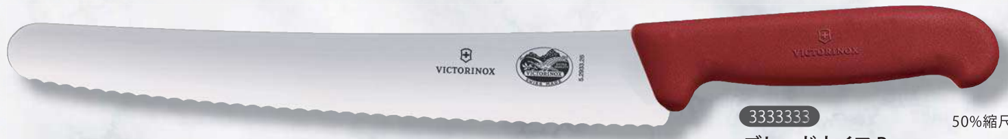
コッペ・明太フランスに 緩やかなカーブが腹割り作業に最適! 3333333 50%縮尺 ブレッドナイフ Pro 刃渡り: 26cm 全長: 38.3cm