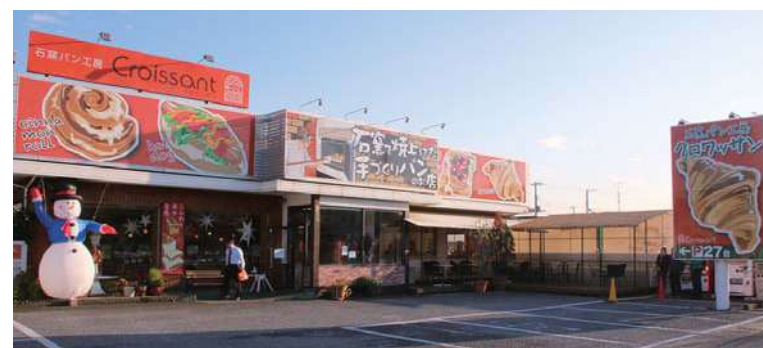
有限会社クロワッサン クロワッサンファクトリー五井店

千葉県木更津市で生まれる。幼少期から実家が経営していた『クロワッサン』を見て育ち、昔から食べることが大好きで、食に関心が高かったことと両親の力になりたい一心で、大学3年の時に家業を継ぐことを決意する。大学卒業後入社し、自分が近い将来、会社を動かして欲しいという気概をもって仕事に取り組み、25歳の時に五井店の店長に就任。「地域の方々にとって、なくてはならない存在になる」を目標に掲げ、日々取り組んでいる。現在『木更津店、君津店、五井店、みなのお店、木更津ワシントンホテル 店』と千葉県上総エリアに5店舗展開。