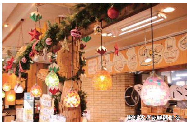
照明なども手掛ける

を一杯にしたお客様は売り場後半のパンを「トレー」に乗りきらない」という理由で購入を諦めます。それを何とか打破したく思い、当店ではコース料理のイメージで人気ベスト5はカテゴリー毎に分けて棚に配置し、甘系、調理系、惣菜系、食事系を順繰り選べ、売り場を1周回って満足できる様にパンの配置も改善しました。 入口正面に人気商品1位を置き、すぐ左に季節商品を置くことで、季節感を出すのと同時にワクワク感も演出し、生活者に飽きさせない工夫を心掛けています。(図①参照)