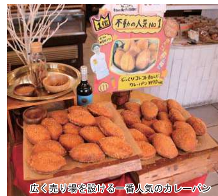
広く売り場を設ける一番人気のカレーパン

戦略的な売上ベスト5 アイテムの育て方 少し矛盾した話になりますが、お客様に人気のある商品(良く売れる商品)を製造強化するのではなく、作り手の自分たちが食べて欲しいと思える商品を育てることに意識改革しました。スタッフ全員で話し合い、育てていく(販売個数を増やす)5アイテムを決めました。 販売個数を増やす為には、その商品を集中して宣伝する! 即ち、売り場スペースをしっかりと確保することが必要となり、必然的に100種類あったアイテムを70種類に絞る事となりました。数が絞られた事により、その5アイテムの「3たて」の回数が増え、結果的にお客様に喜ばれる人気商品となりました。 アイテム数を減らす事はとても不安でしたが、結果として売上も以前と比べ土日の日商が40万円が90万円と嬉しい結果になりました。