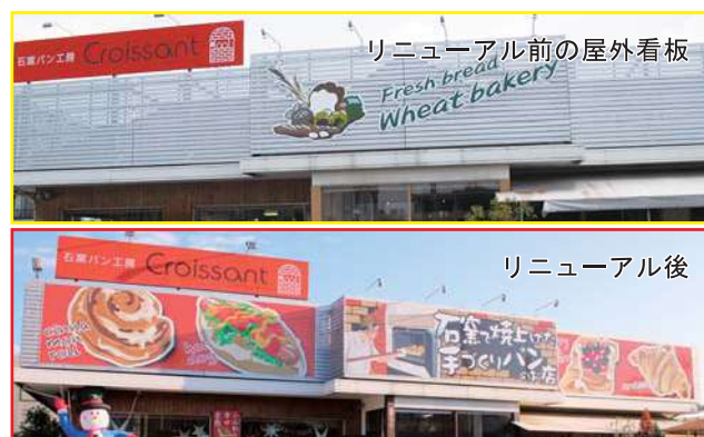
リニューアル前の屋外看板