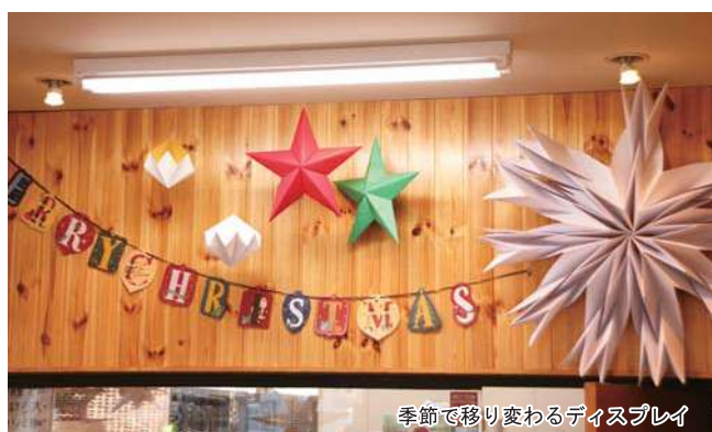
季節で移り変わるディスプレイ