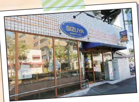
志津屋 本店 615-0096 京都市右京区山ノ内五反田町10