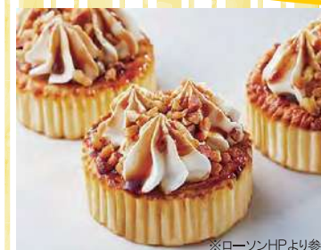
プレミアムバスチー 320円 (税込)

下記のレシピ・・・ 焼成冷凍 ができます! 出したいときに焼きたい数量だけです! また半解凍でも違う食感で美味しいです。