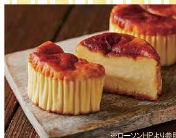
バスチー バスク風チーズケーキ 215円 (税込)

CVSでも大人気! “レアでもない、ペイクドでもない”しっとりなめらかな食感が特徴。チーズの濃厚な風味と、焦がしキャラメルのアクセントも人気の秘密!