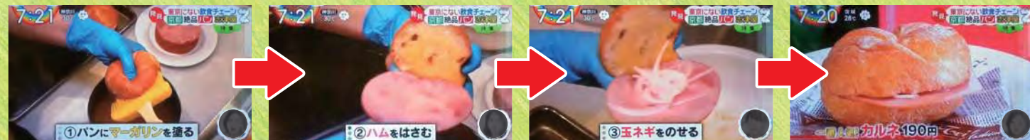
①パンにマーガリンを塗る ②ハムをはさむ ③玉ねぎをのせる ④完成!

※コンテンツ引用元: 志津屋 公式HP http://www.sizuya.co.jp/ ※情報元: 日本テレビ系列 (NNS加盟) 『ZIP!』 (ジップ!), 2019年 (平成31年) 8月27日放送より